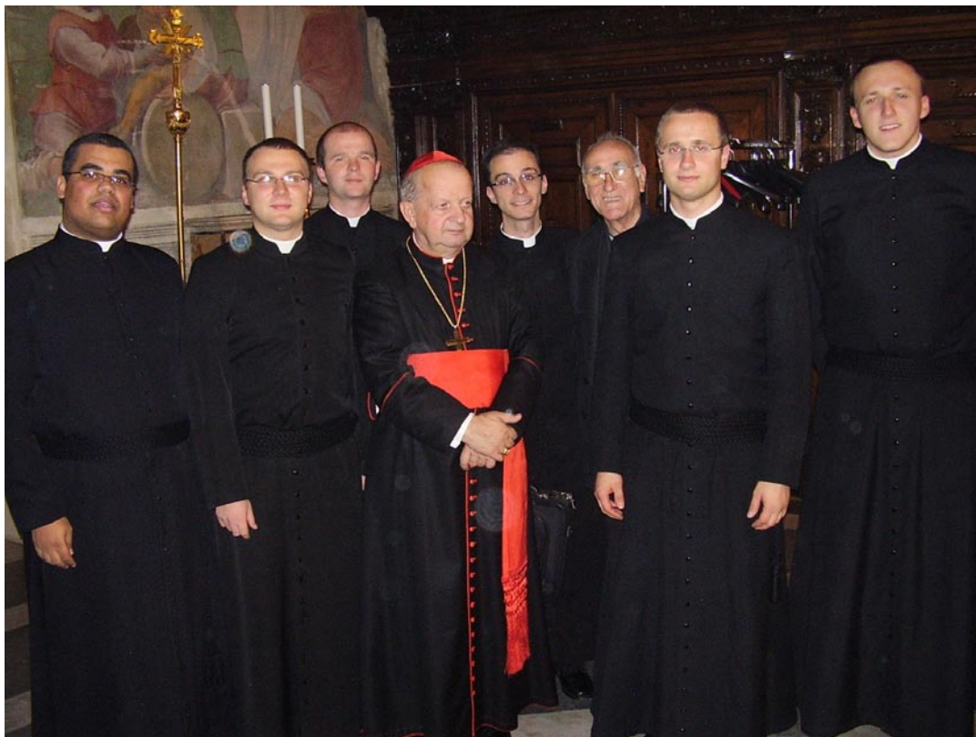
Kolegium wraz z kardynałem Stanisławem Dziwiszem