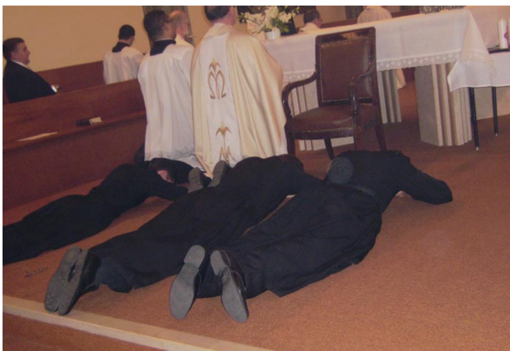
Litanie do wszystkich świętych