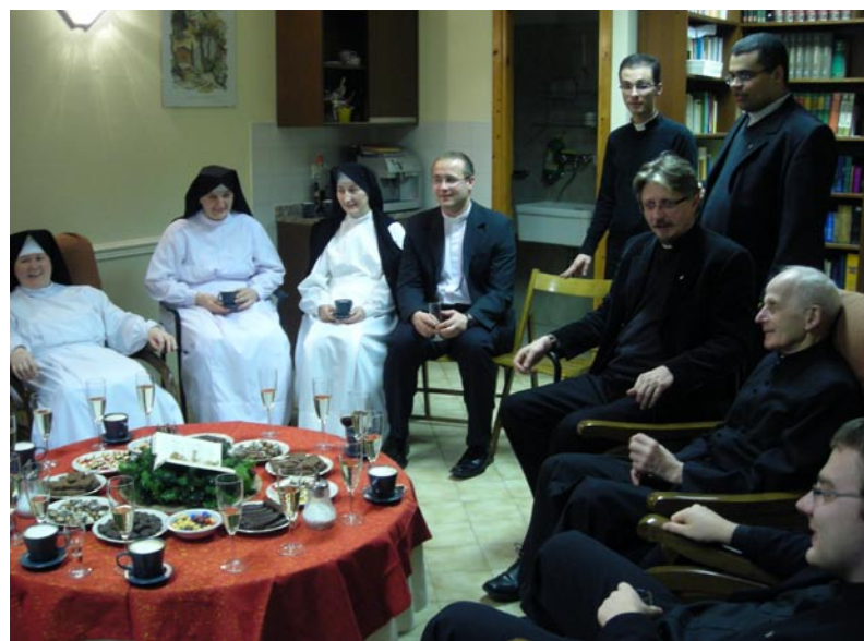
Rekreacja razem z siostrami i członkami Domu Generalnego