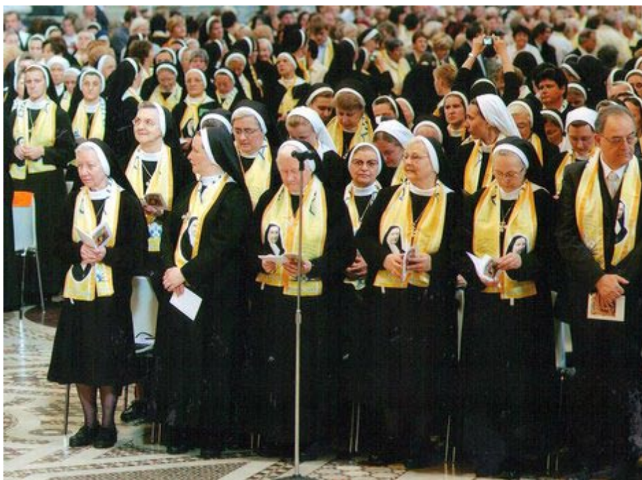
W bazylice św. Jana na Lateranie 26.10.2007