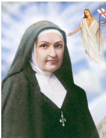
Błogosławiona Matka Celina Borzęcka CR