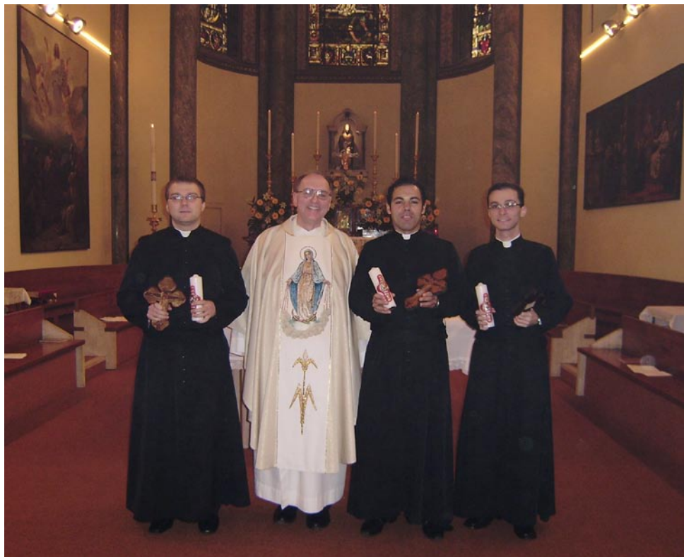
Już neoprofesi razem z Ojcem Generałem