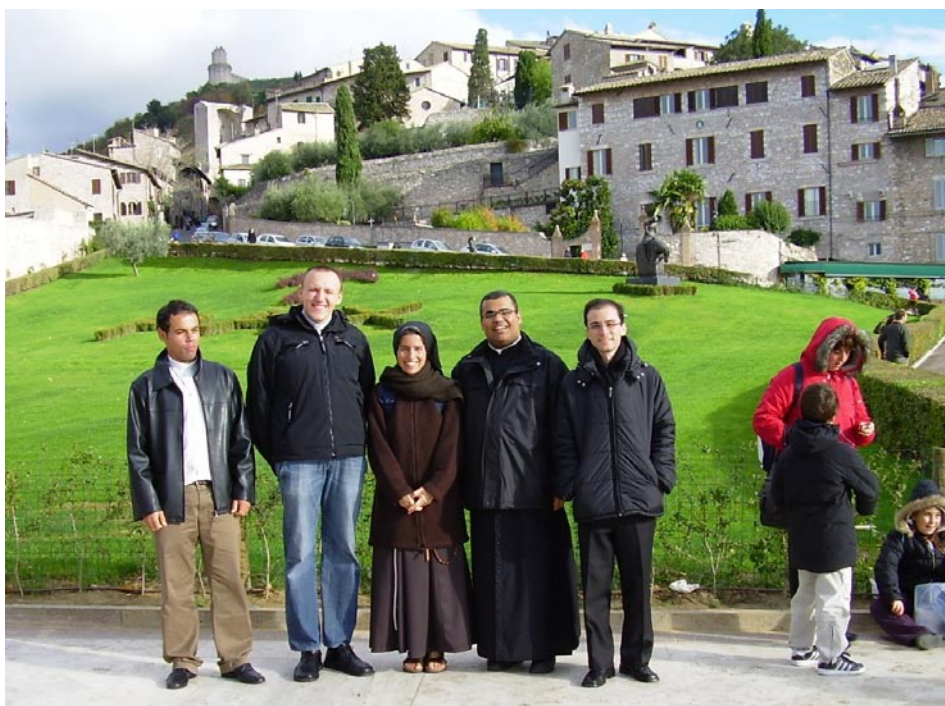
Klerycy w Asyżu

Jest już tradycją, że w uroczystość wszystkich świętych całe kolegium, wspólnie z członkami Domu Generalnego, idzie na cmentarz Campo Verano, by modlić się za zmarłych współpracownikami.