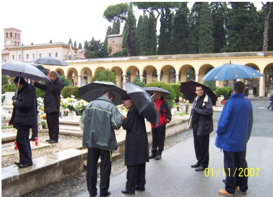
Na cmentarzu Campo Verano