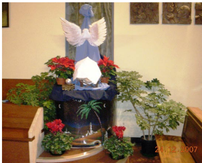
Szopka w kościele (w tym roku trochę inna)