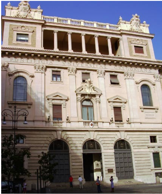
Papieski Uniwersytet Gregoriański

Początek roku akademickiego 2007/2008 na Papieskim Uniwersytecie Gregoriańskim.